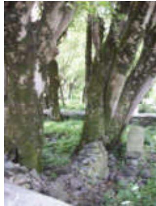
Sarı pir. Zaqatala rayonu, Qımır-Bazar kəndi

- Gecə həyətimdən heyvanlarım oğurlanmışdı. Oğrunu təxmin etsəm də,