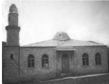
Gədəbəy rayonunun Cümə məscidi

Onların çoxlu qızları vardı. Qadın yenidən hamilə idi. “Ocaq” ziyarətgahına qurban götürmüşdülər ki, bu dəfə oğulları olsun. Bir gün eşitdik ki, bu alənin qızı olub. Kişi bundan hirslənib, gedib ziyarətgahı dağıdıb. Eşidəndə çox pis olduq. Həmin gecə yayın ortası olmasına baxmayaraq güclü qar yağdı, heyvanlar yeməyə ot tapmadılar. Pis vəziyyətdə qaldıq. Kişilər toplaşdı, “Ocağı” bərpa etdilər, ondan sonra hava açıldı. Buranı dağdan kişinin bütün heyvanlarını sel apardı.