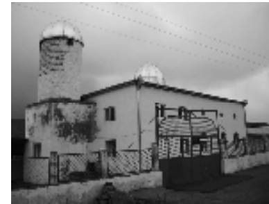
Gədəbəy rayonunun Yenikənd məscidi