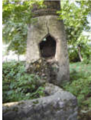
Sufilərin Qımır kəndindəki təkyəsi. Zaqatala rayonu

raq, axşam övliyanın həyə-tinə oğurluğa girir. Qeyd edir ki, hamı kimi Şeyxin də həyətinin yanına yul-ğundan çəpər çəkilməmiş, ağacdan doqqaz qoyulmuş-du. İlk baxışdan həyəətə gir-mək və buradan oğurluq etmək o qədər də çətin gö-runmürdü. Oğru da elə bu-na arxayın idi. Nə isə... Bu zavallı bir gecə övliyanın həyətinə girdi və eşikdəki