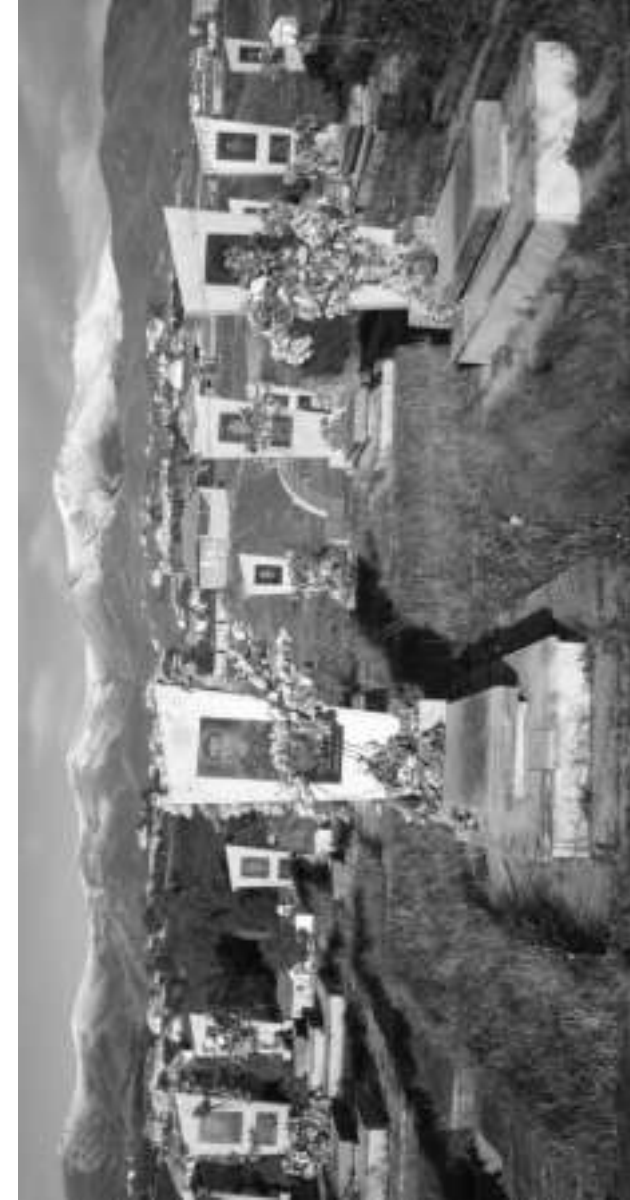
Gədəbəy rayonunun müqəddəs yerlərindən olan Şəhidlər xiyabanı