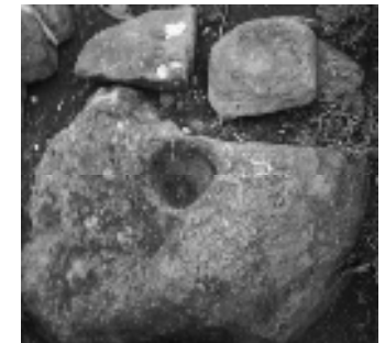
«Düldül» ziyarətghası. Gədəbəy rayonu, Arıxdam kəndi