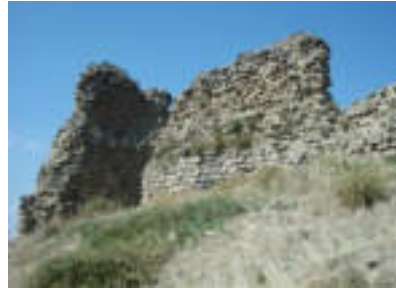
Xızır Zində pirindəki qədim tikilinin qalıqları

Gənc yaşlarımda bir gecə ailəlikcə evdə yatmışdım – deyə, müsahibim söhbətini davam etdirir: - Otaqda məndən başqa anam və kiçik bacı-qardaşlarım vardı. Gecə yuxudan ayılıb, anamın üstünün