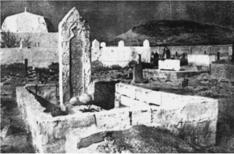
Sofi Həmidin məqbərəsi

Bütün bunlara baxmayaraq, Sofi Həmidin məqbərəsi xalq tərəfindən müqəddəs sayılıb, daim ziyarət olunur.